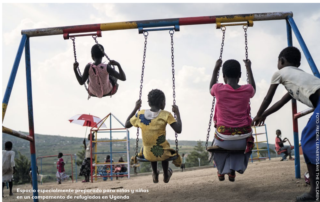
Espacio especialmente preparado para niños y niñas en un campamento de refugiados en Uganda

Sin embargo, el compromiso de los donantes de proporcionar USD 50 millones para integrar servicios de salud mental y apoyo psicosocial en la educación, además de garantizar la reposición plena del fondo «La educación no puede esperar», redundará en beneficio de niños y niñas. Aumentar el acceso a la educación en casos de emergencia e integrar allí los servicios de salud mental y apoyo psicosocial es fundamental para proteger la salud mental infantil.